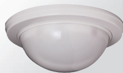
人感（遠赤外線検知）センサー