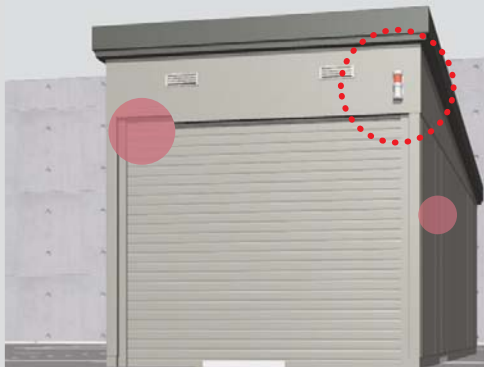
イメージCG(シーン/倉庫防犯)