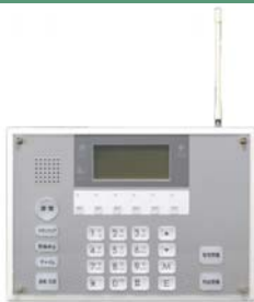
コントローラ (双方向無線対応型) RXT-700CTI