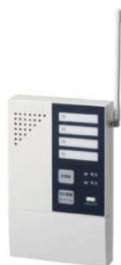
ワイヤレス受信機 (4周波切替/双方向無線対応型) RXTF-370