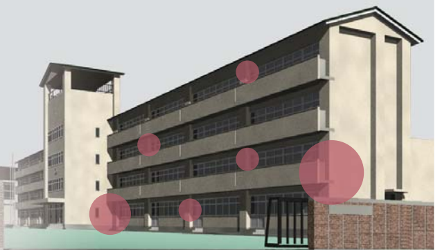
イメージCG(シーン/学校防災システム)