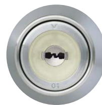
キーウェイ形状 (スリバチ蓄光仕上)